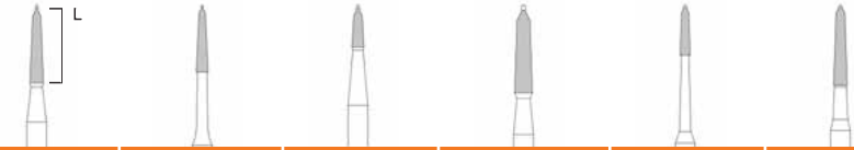
Hartmetallinstrumente Tungsten carbide burs