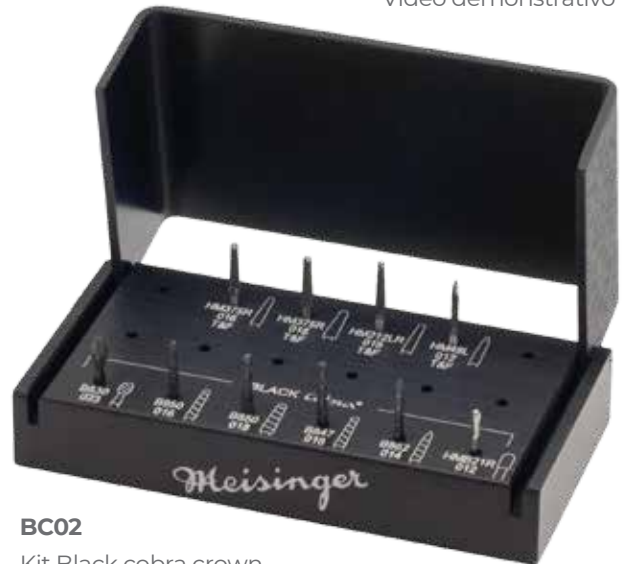
BC02 Kit Black cobra crown Preparation Kit

O Kit Meisinger's Black Cobra para preparação de coroas é um kit versátil com os diamantes exclusivos Black Cobra para uma redução do dente rápida e eficaz. O kit também inclui brocas de carbonetos de corte e acabamento correspondentes para definir e suavizar a preparação.